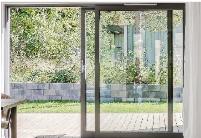
Exempelbild på stödmur.

Med min underskrift bekräftar jag mitt samtycke, utan invändningar, att Ladugårdsvägen 28 bebyggs med stödmur, enligt vad som presenteras i detta dokument inkl rimliga justeringar som kan komma att krävas pga markförhållanden eller myndighet.