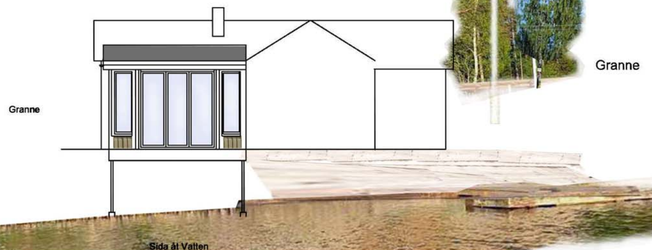
Sida åt Vatten