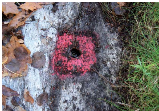
Hål i berg