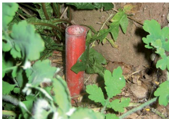
Rör i marken