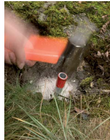
Markerar i terrängen...