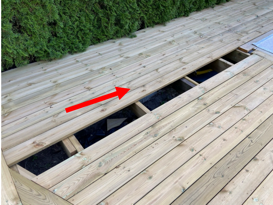
Saknas delar av trallen På flera ställen är trallen ej färdig